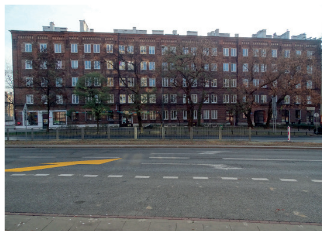
Kamienica frontowa Kolonii Wawelberga