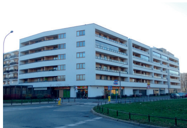
Wola. Współczesna zabudowa brak detalu architektonicznego.