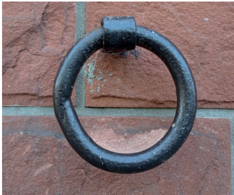
Uchwyt do mocowania koni Praga al. Solidarności 61.

e) DROBNY DETAL – do tej grupy zaliczymy wszelkie okucia, uchwyty do przywiązywania koni czy bydła, wsporniki dla flag, numerki domów, kraty czy rolety witrynowe.