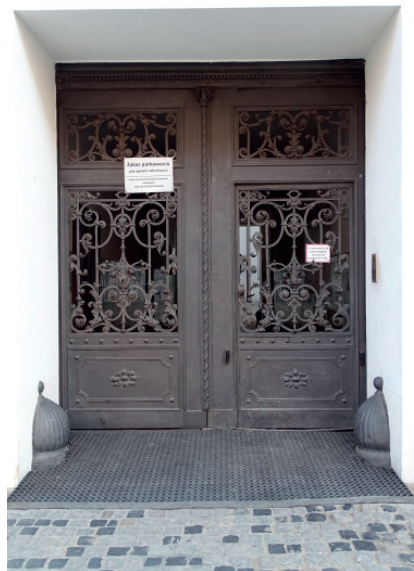
Wrota bramne Śródmieście, ul. Noakowskiego 12.

Materiał używany do bram sprowadzał się właściwie do dwóch rozwiązań: drewnianych (z żelaznymi okuciami) i żelaza. W pierwszym przypadku konstrukcja była ramowo-płycinowa, w drugim najczęściej szkieletowa (łączona na nity i spawy bądź odlewana). Generalnie wyróżnić można trzy typy bram: dwuskrzydłowe, dwuskrzydłowe z nieruchomym nadświetłem i trójskrzydłowe. Pierwszy typ był często bardzo niepraktyczny i niewygodny w użyciu, gdyż otwarcie tak dużych skrzydeł bramnych wymagało użycia dużej siły. Stąd od drugiej połowy XIX w. zaczęto