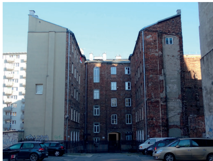
Kamienica wraz z oficynami, Śródmieście, zabudowa przedwojenna.

Od samego początku budynek w kształcie swojej bryły, spełniając zarówno techniczne, jak i praktyczne wymagania, rzadko kiedy był prosty w swojej formie. Nawet społeczeństwa żyjące na niskim poziomie kulturalnym starały się zgodnie z naturalnym dążeniem człowieka do piękna nadać swojej budowli pewne cechy charakterystyczne wzbogacające wygląd i uwypuklające harmonię proporcji. Detal w architekturze to fragment szczegółu budowli, np. okno, jego obramowanie, a często nawet szczegół każdego elementu jak profil lub zbiór pewnych motywów czyli ornament. Różnica między detalem a ornamentem w głównej mierze polega na tym, iż ornament pełni funkcję głównie dekoracyjną, zaś detal jest pojęciem nieco szerszym, obejmując jednocześnie funkcje użytkowe, dekoracyjne czy informacyjne. Jeden i drugi element stosowano dla podkreślenia struktury, kompozycji elewacji czy układu przestrzennego obiektu. Pierwotnym źródłem wzorów dla motywów zdobniczych była natura, stąd ich generalny podział na roślinne, zwierzęce i geometryczne.