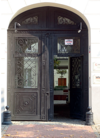
Wrota bramne Praga, ul. Jagiellońska 22.