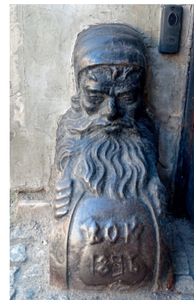
Odbój bramny w kształcie krasnala Śródmieście kamienica ul. Nowy Świat.