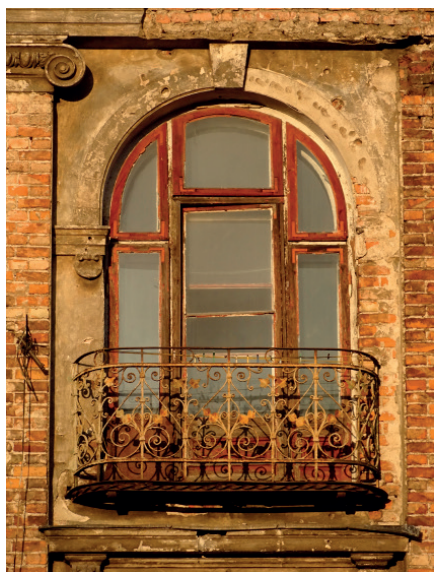
Balkon kamienicy ul. Marcinkowskiego 9.

wspierały żeliwne wsporniki, z których najpopularniejszy był krokwostyn ażurowy z żeliwa i jego późniejsze odmiany. W kamienicach bardziej reprezentatywnych wsporniki często miały formę pełną (w środku pustą), a w późniejszych latach wsparte były na belkach dwuteowych pokrytych atrapą z blachy imitującą podporę kamienną. Od lat 90. XIX w. zaczęto coraz częściej wprowadzać stal podatną na obróbkę plastyczną, co miało ogromny wpływ na technikę wykonania i estetykę balkonów.