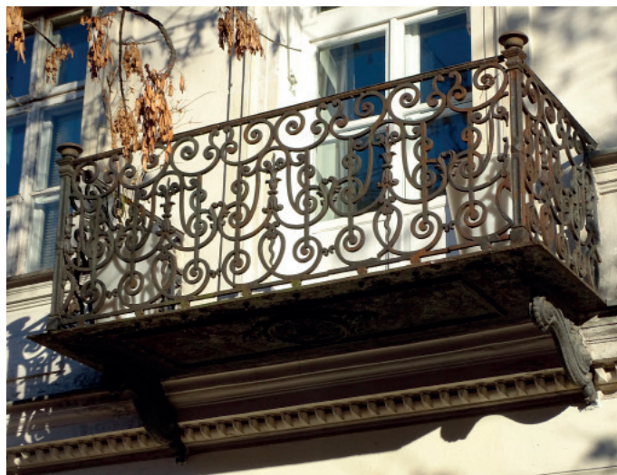
Balkon Śródmieście, kamienica ul. Emilii Plater.

Wyznacznikiem materiału było oczywiście położenie balkonu. W omawianym okresie na wyższych kondygnacjach niemal zawsze stosowano żelazo, natomiast pierwsze, najbardziej reprezentatywne piętro, zdobiły balkony z kamienia z tralkami kamiennymi bądź betonowymi. Płytę balkonu