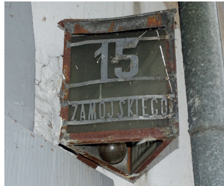
Przedwojenny podświetlany numer domu.