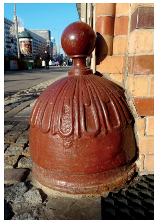
Odbój bramny kopolasty Śródmieście, kamienica ul. Marszałkowska

W kolejnych latach, oprócz modyfikacji rozmiaru i wysokości, zaczęły się pojawiać mocno wyróżniające się odboje w formie kłęczących krasnali trzymających tarczę z datą, a następnie odboje zaokrąglone i kopolaste, często zwieńczone u góry gałkami, a po bokach dekorowanych kołnierzem z liści bądź motywem wydłużonych linii zbiegających się w okolicach gałek. Rzadszą odmianę stanowią odboje w formie rurowych pałaków o przekroju okrągłym. Rów-