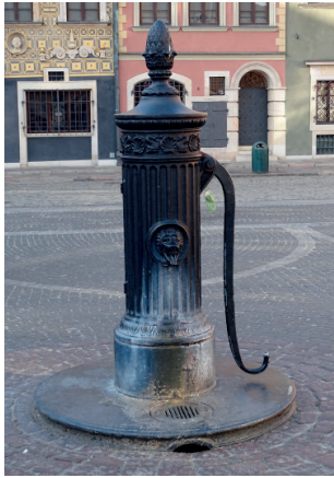
Zdjęcie. Dawny miejski punkt czerpania wody. Rynek Starego Miasta.

niez nieco rzadziej występowały oddzielnie bądź jednocześnie z odbojami pachotki – okrągłe wolnostojące przed przejazdem słupki, na których zawieszano łańcuch w celu uniemożliwienia wjazdu osobom postronnym przy otwartych wrotach bramnych. Potrzeba stosowania odbojów zanikła wraz z rozwojem środków transportu i zmianą architektury, tj. domów bez przejazdów bramnych.