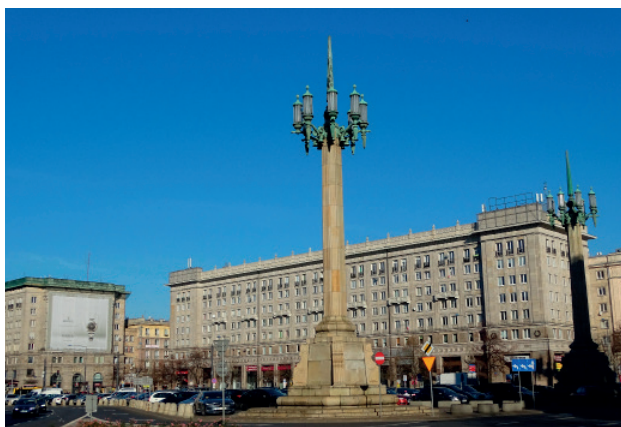
Zabudowa powojenna. MDM Śródmieście.

W historii architektury detal uważany jest za środek wyrazu wyróżniający daną epokę czy styl. Dzięki poszczególnym rozróżnieniom, możemy lepiej identyfikować obiekty, określać czas ich powstania i dokonywać odpowiedniego ich wartościowania. W historii architektury zmieniał się nie tylko sam detal, ewoluując bądź nawiązując do klasycznych form, ale również był mocno odczuwalny różnicowany stosunek do niego architektów, urbanistów czy zwykłych odbiorców. Wiedza na temat detalu architektonicznego jest potrzebna w działaniach wykonawczych, budowlanych czy technologicznych.