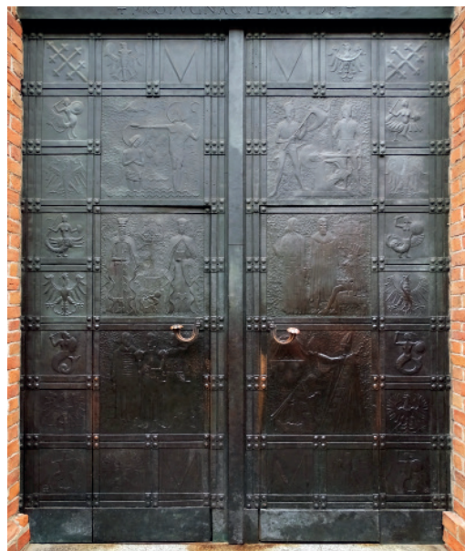
Drzwi Bazyliki archikatedralnej św. Jana Chrzciciela na Starym Mieście.