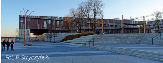
Fot. P. Stryczyński

http://www.metro.waw.pl/historia-budowy-metra-w-warszawie