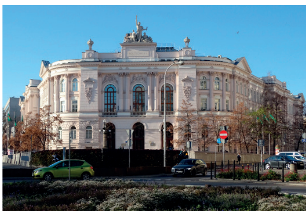
Gmach Główny Politechniki Warszawskiej