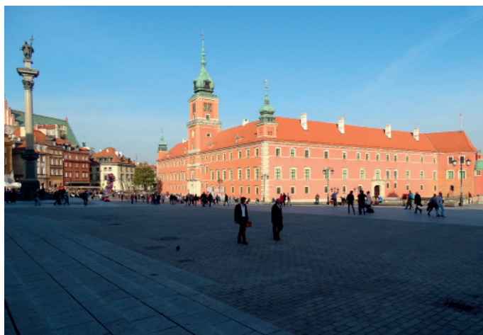
Zamek Królewski.

„Rzecz pochodząca z minionych epok, mająca dużą wartość historyczną i naukową” ( Uniwersalny słownik języka polskiego , red. Stanisław Dubisz, Wydawnictwo Naukowe PWN, Warszawa 2003, t. 4, s. 749).