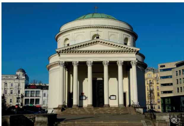
Kościół Św. Aleksandra na Pl. Trzech Krzyży