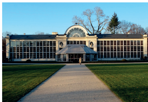
Nowa Pomarańczarnia, Łazienki Królewskie