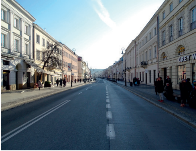
Ul. Nowy Świat – część Traktu Królewskiego – pomnika historii