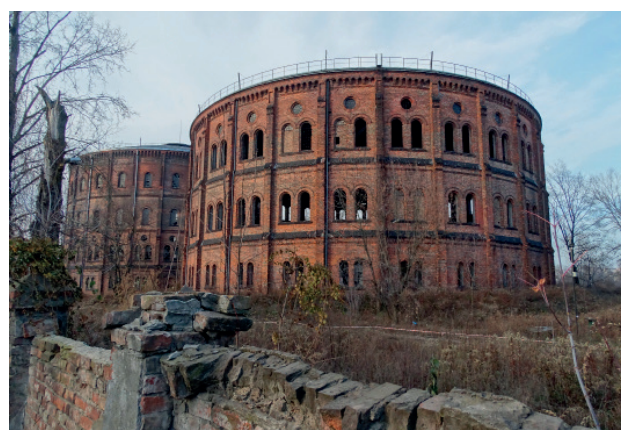
Gazownia na Woli

Ad 5. „(...) ZE WZGLĘDU NA POSIADANĄ WARTOŚĆ HISTORYCZNĄ, ARTYSTYCZNĄ LUB NAUKOWĄ” – w procesie uznawania rzeczy za zabytek konieczne jest odwołanie się do wartości: