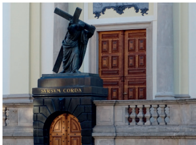
Kościół św. Krzyża