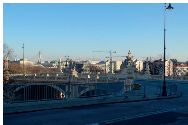
Ślimak na ul. Karowej prowadzący na Powiśle