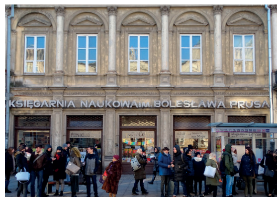
Księgarnia im. Bolesława Prusa