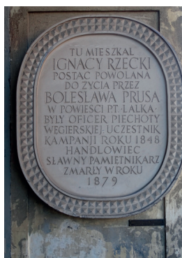
Tablica pamiątkowa Ignacy Rzecki